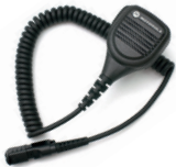
Micrófono de Altavoz Remoto