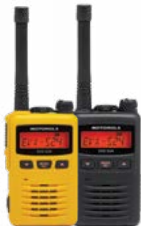
EVX-S24 (в желтом цвете) EVX-S24 (в черном цвете)