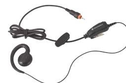
Auricolare con pulsante PTT in linea

Questo rivoluzionario design pulito consente di ricaricare rapidamente la radio Motorola CLP. Un caricatore multi-unità offre la possibilità di ricaricare comodamente fino a sei CLP Motorola simultaneamente. Il caricatore è dotato di una tasca posteriore per contenere l'auricolare mentre l'unità è sotto carica e può essere montato al muro ove vi siano problemi di spazio.