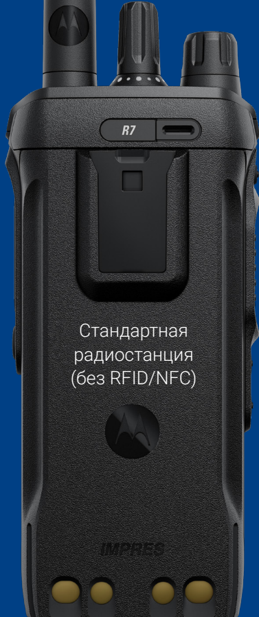
Стандартная радиостанция (без RFID/NFC)