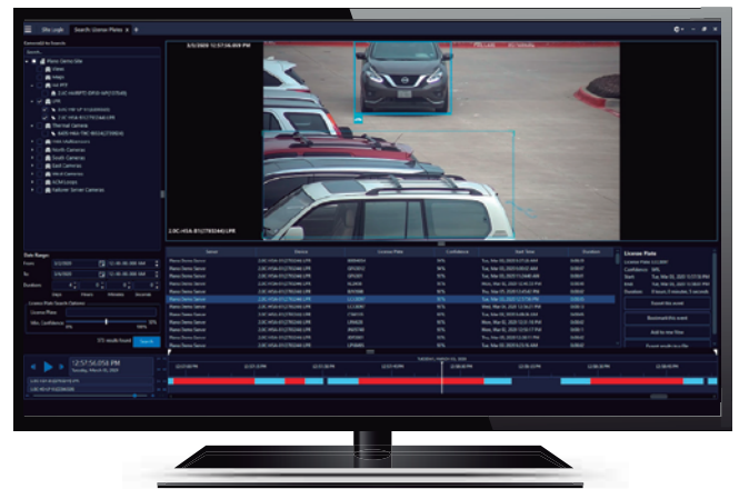
Reconocimiento de placas de vehículo

Supervisar sus instalaciones puede ser un desafío. Los pacientes, visitantes y personal entran y salen constantemente. Proteger sus instalaciones lleva tiempo y horas de personal, y es cada vez más difícil con las dimensiones de sus instalaciones y los múltiples complejos. Desde controlar múltiples puntos de acceso, supervisar los movimientos del personal, pacientes y visitantes hasta asegurar y monitorear las áreas sensibles, la detección juega un rol crítico a la hora de mejorar el reconocimiento de la situación y disminuir los tiempos de respuesta a potenciales amenazas y problemas operativos. La video seguridad integrada utiliza inteligencia artificial para crear alta visibilidad en sus instalaciones y ayuda a disuadir potenciales amenazas. El reconocimiento automático de placas de vehículo analiza los vehículos que ingresan y egresan de su campus. El control de acceso proporciona gestión de ingreso, capacidades de cierre inmediato y notificaciones automáticas a dispositivos. Las alertas de radio aseguran que todo el personal – a través de múltiples equipos – esté informado sobre información crítica de forma simultánea.