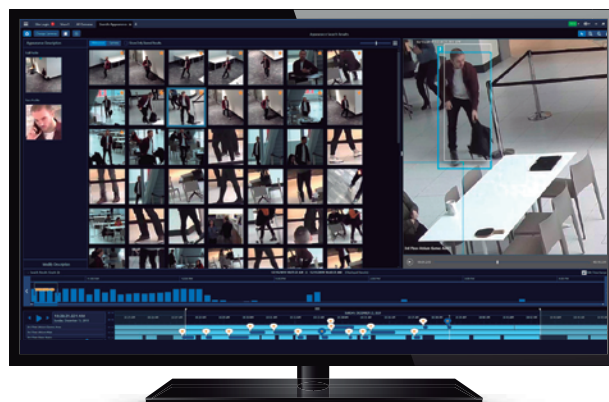
Búsqueda por apariencia

Por último, estas soluciones e información son fundamentales para centrarse en lo importante, localizando puntos de interés y reconociendo los eventos importantes – a fin de que pueda tomar decisiones fundamentadas para entrar en acción. Todo esto se combina para brindarle mejor información – a fin de que siempre sepa qué está pasando en sus instalaciones.