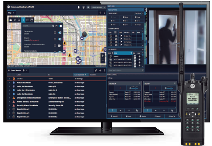
Centro de comando

Ya sea un incidente de todos los días o una situación de emergencia, las instituciones de asistencia médica deben comunicarse entre ellas para coordinar una respuesta de la forma más eficiente posible. Estar preparado e informado es fundamental para garantizar que su equipo responda con rapidez a los problemas antes de que estos escalen. La interoperabilidad dinámica simplifica la posibilidad de compartir datos en tiempo real y de forma directa con los oficiales de seguridad, mejorando el reconocimiento de la situación. La gestión de incidentes optimiza el registro de informes de incidentes y simplifica la posibilidad de compartir multimedia con otros miembros del personal. Porque permitir respuestas rápidas y documentar incidentes pasados puede ser la clave para evitar que un incidente termine en una tragedia. Informados en todo momento.