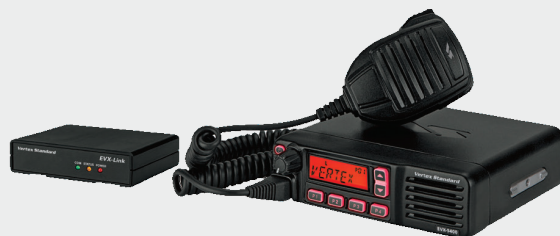
EVX-Link 和 EVX-5400