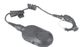
关键业务无线耳机

“当我看到摩托罗拉 SL 系列的第一眼,我以为它是一部手机,而不是真的双向对讲机。它拥有双向对讲机的一切功能,但外形却如此专业、隐秘,可谓与我们的制服浑然天成的绝配。”