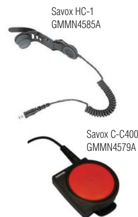
Savox HC-1 GMMN4585A

Компактный шлемофонный модуль Savox HC-1 предназначен для специалистов, работающих в опасных условиях. Он легко крепится на большинство касок и обеспечивает четкую и громкую связь, что делает его идеальным решением для пожарных и сотрудников служб спасения.