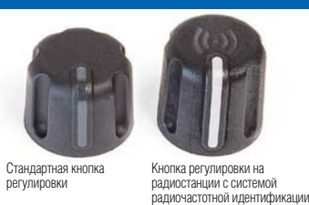
Стандартная кнопка регулировки

Разноцветные кольца помогают идентифицировать радиостанции для групп с различными задачами, зоной покрытия или сменами.