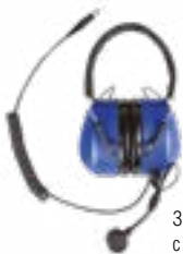
Защитные наушники с двухслойными чашками