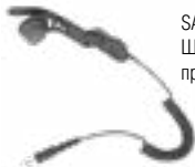
SAVOX HC-1 Шлемофон с микрофоном костной проводимости и наушником HC-1