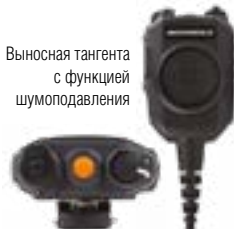
Выносная тангента с функцией шумоподавления