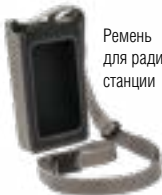
Ремень для радио- станции