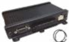
Комплект для монтажа в автомобиле