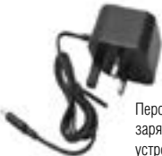
Персональное зарядное устройство