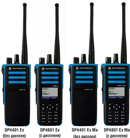
DP4401 Ex (без дисплея)

DP4801 Ex Ma - модель с полной клавиатурой и цветным дисплеем для работы под землей