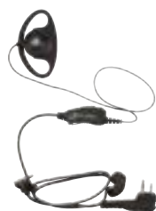
Zdalny mikrofonogłośnik z przyciskiem nadawania (PTT)