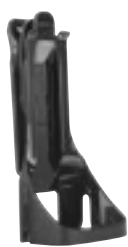
Uchwyt do noszenia