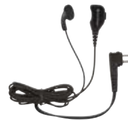
Słuchawka typu D z mikrofonem i przyciskiem PTT na przewodzie

Radiotelefony serii XT600d są kompatybilne z akcesoriami serii XT400 z wyjątkiem uchwyty do noszenia i futerału skózanego.