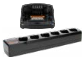
Ładowarki jedno- i wielostanowiskowe