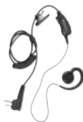
Słuchawka douszna z mikrofonem i przyciskiem PTT na przewodzie