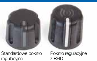
Standardowe pokrtyło regulacyjne

◀ Kolorowe pierścienie identyfikacyjne dla grup wykonujących różne zadania, działających na różnych obszarach lub pracujących na poszczególnych zmianach.