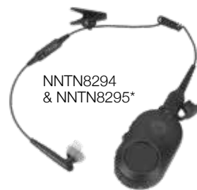
NNTN8294 & NNTN8295*

Moduł Bluetooth 2.1 audio wbudowany w radiotelefon umożliwia szybkie i bezpieczne parowanie urządzenia z różnymi akcesoriami Bluetooth. Łatwo podłączane i parowane akcesoria Motorola Solutions Bluetooth poprawiają parametry i bezpieczeństwo pracy funkcjonariusza, który może skuteczniej pracować w ukryciu i dyskretnie utrzymywać łączność bez kabli.