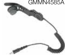
Savox HC-1 GMMN4585A

Savox HC-1 to kompaktowy zestaw podhełmowy dla osób pracujących w niebezpiecznych warunkach. Można go łatwo zainstalować pod większością hełmów. Urządzenie zapewnia wyraźny dźwięk i niewymagającą użycia rąk łączność w trakcie akcji gaśniczej lub ratunkowej.