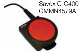
Savox C-C400 GMMN4579A

Urządzenie można rozszerzyć o moduł sterowania łącznością Savox C-C400 , zapewniający dwukierunkową łączność radiową w niebezpiecznych warunkach. Solidny i bardzo duży przycisk push-to-talk zaprojektowany pod kątem ekstremalnych warunków zapewnia łączność nawet osobom pracującym w maskach i kombinezonach ochronnych.