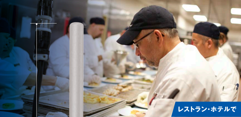
レストラン・ホテルで