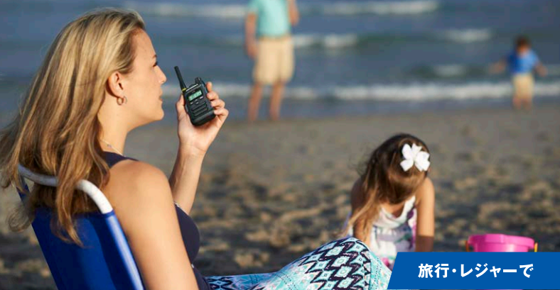
旅行・レジャーで