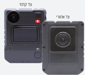
מספר קטלוגי: VB440-64-KF-N

שים לב: דרוש רישיון VideoManager ארגוני או שירות ענן VideoManager. אנא פנה לנציג החברה לקבלת פרטים נוספים.