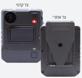
מספר קטלוגי: VB440-64-ALIG-N

שים לב: דרוש רישיון VideoManager ארגוני או שירות ענן VideoManager. אנא פנה לנציג החברה לקבלת פרטים נוספים.