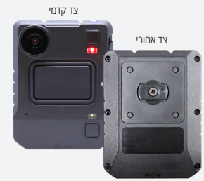
מספר קטלוגי: VB440-64-KF-N

שים לב: דרוש רישיון VideoManager ארגוני או שירות ענן VideoManager. אנא פנה לנציג החברה לקבלת פרטים נוספים.