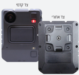
מספר קטלוגי: VB440-64-QR-N

שים לב: דרוש רישיון VideoManager ארגוני או שירות ענן VideoManager. אנא פנה לנציג החברה לקבלת פרטים נוספים.