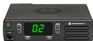
MOTOTRBO Gamme DM1000