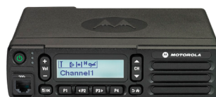
MOTOTRBO Gamme DM2000