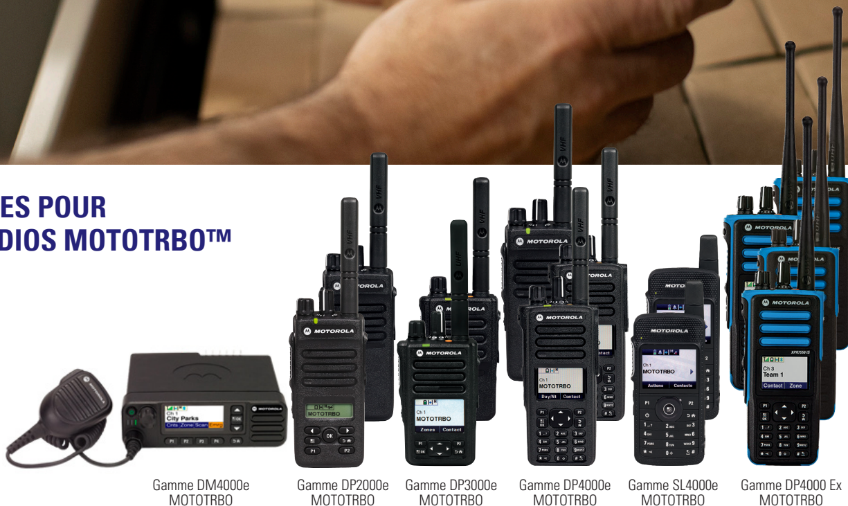
Gamme DM4000e MOTOTRBO