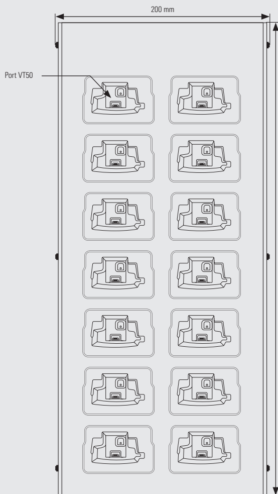
Vue du dessus