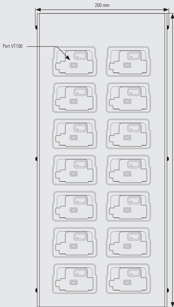
Vue de dessous