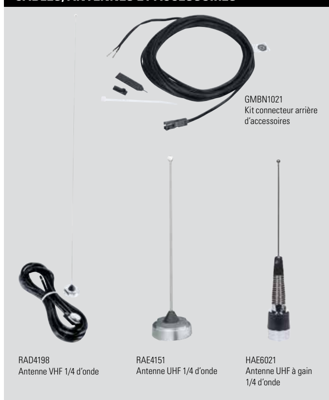
RAD4198 Antenne VHF 1/4 d'onde