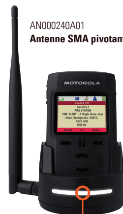
PMPN4142 Station d'accueil