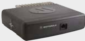
TÊTE D'EXTENSION CONNEXION STANDARD UNIQUE