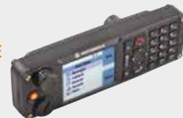
TÊTE DE COMMANDE IP67