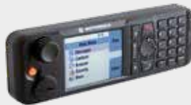
TÊTE DE COMMANDE À DISTANCE