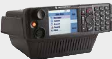
MONTAGE SUR BUREAU CENTRE DE CONTRÔLE