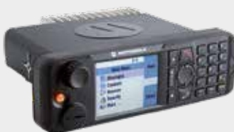
FIXATION SUR TABLEAU DE BORD VOITURE, CAMION