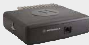
MONTAGE DE LA TÊTE À DISTANCE VOITURE, AMBULANCE, CAMION DE POMPIER