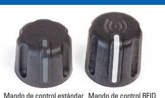
Mando de control estándar Mando de control RFID

◀ Bandas de identificación de colores opcionales para grupos de usuarios con diferentes tareas, área de cobertura o turnos