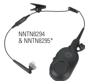
NNTN8294 & NNTN8295*

El audio Bluetooth 2.1 está integrado en la radio, permitiendo así un ajuste rápido y seguro con una variedad de accesorios Bluetooth. Fácil de conectar y combinar, los accesorios Bluetooth de Motorola Solutions aumentan el rendimiento y la seguridad dondequiera que trabaje. Los agentes pueden hablar discretamente de forma encubierta, moverse sin cables y utilizar las radios como nunca antes.