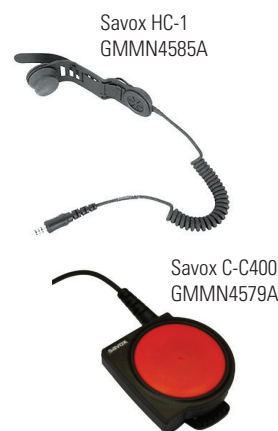
Savox HC-1 GMMN4585A

Complete la solución con la unidad de control Savox C-C400 que permite el uso de su Radio en condiciones peligrosas. Diseñada para ser especialmente robusta en los entornos más extremos, el botón extra-grande de PTT garantiza la transmisión, incluso cuando se utiliza por debajo del equipo y con ropa protectora.