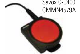
Savox C-C400 GMMN4579A

Complete a solução com a unidade de controlo Savox C-C400 que permite usar o seu rádio bidireccional em condições perigosas. Projectado para ser especialmente robusto na maioria dos ambientes extremos, o botão PTT de grandes dimensões garante uma transmissão bem-sucedida mesmo quando usado debaixo de equipamentos e vestuário de protecção.