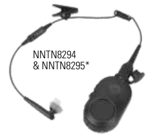
NNTN8294 & NNTN8295*

O áudio Bluetooth 2.1 está integrado no rádio permitindo um emparelhamento rápido e seguro com uma variedade de acessórios Bluetooth. Fáceis de montar e emparelhar, os acessórios Bluetooth Motorola Solutions melhoram o desempenho e a segurança onde quer que opere. Os agentes podem falar discretamente sem ser ouvidos, movimentar-se sem fios e usar os rádios de uma forma inovadora.