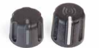
Botão de controlo padrão Botão de controlo RFID

◀ Anéis de identificação coloridos opcionais para grupos com diferentes tarefas, áreas de cobertura ou turnos.