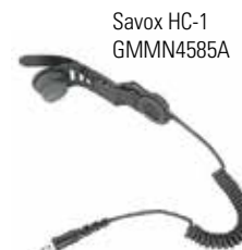
Savox HC-1 GMMN4585A

O Savox HC-1 é uma unidade de comunicação para uso em capacetes de profissionais que trabalham em condições perigosas. Fácil de instalar na maior parte dos capacetes, oferece comunicação clara e mãos-livres, o que o torna ideal para bombeiros e socorristas.