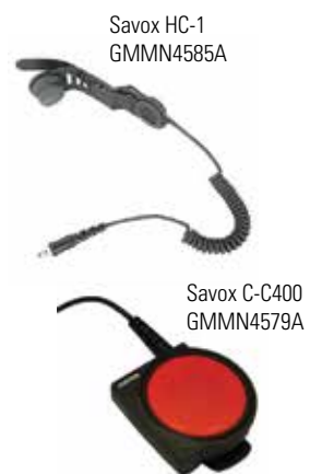
Savox HC-1 GMMN4585A

Il Savox HC-1 è un'unità compatta combinabile con casco per i professionisti che lavorano in condizioni rischiose. Si monta facilmente sulla maggior parte degli elmetti e offre comunicazioni chiare e a mani libere che lo rendono un accessorio particolarmente adatto a vigili del fuoco e squadre di salvataggio.