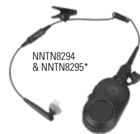
NNTN8294 & NNTN8295*

L'audio Bluetooth 2.1 è integrato nella radio per consentire l'accoppiamento rapido e sicuro con una varietà di accessori Bluetooth. Semplici da collegare e abbinare, gli accessori Bluetooth Motorola Solutions migliorano le prestazioni e la sicurezza in qualunque ambiente di lavoro. Gli agenti possono comunicare in maniera discreta quando sono in incognito, spostarsi senza l'ingombro di cavi e usare la loro radio come mai prima.