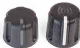
Manopola di controllo standard Manopola di controllo RFID

◀ Anelli identificativi colorati opzionali per gruppi impegnati in mansioni, aree di copertura o turni differenti