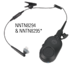
NNTN8294 & NNTN8295*

El audio Bluetooth 2.1 está integrado en la radio, permitiendo así un ajuste rápido y seguro con una variedad de accesorios Bluetooth. Fácil de conectar y combinar, los accesorios Bluetooth de Motorola aumentan el rendimiento y la seguridad dondequiera que trabaje. Los agentes pueden hablar discretamente de forma encubierta, moverse sin cables y utilizar las radios como nunca antes.