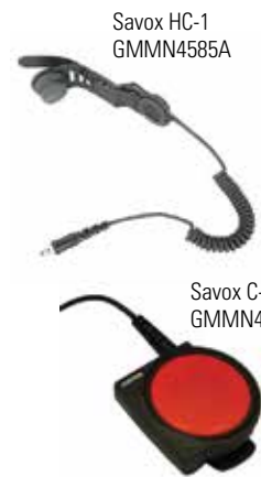
Savox HC-1 GMMN4585A

La Savox HC-1 es una unidad compacta de casco y comunicaciones para profesionales que trabajan en condiciones peligrosas. Se monta fácilmente en la mayoría de tipos de cascos y ofrece una comunicación clara y manos libres que lo hace ideal para los bomberos.