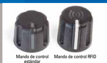
Mando de control estándar

◀ Bandas de identificación de colores opcionales para grupos de usuarios con diferentes tareas, área de cobertura o turnos