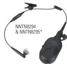
NNTN8294 & NNTN8295*

O áudio Bluetooth 2.1 está integrado no rádio permitindo um emparelhamento rápido e seguro com uma variedade de acessórios Bluetooth. Fáceis de montar e emparelhar, os acessórios Bluetooth Motorola Solutions melhoram o desempenho e a segurança onde quer que opere. Os agentes podem falar discretamente sem ser ouvidos, movimentar-se sem fios e usar os rádios de uma forma inovadora.