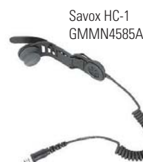
Savox HC-1 GMMN4585A

O Savox HC-1 é uma unidade de comunicação para uso em capacetes de profissionais que trabalham em condições perigosas. Fácil de instalar na maior parte dos capacetes, oferece comunicação clara e mãos-livres, o que o torna ideal para bombeiros e socorristas.