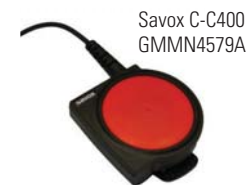
Savox C-C400 GMMN4579A

Complete a solução com a unidade de controlo Savox C-C400 que permite usar o seu rádio bidirecional em condições perigosas. Projectado para ser especialmente robusto na maioria dos ambientes extremos, o botão PTT de grandes dimensões garante uma transmissão bem-sucedida mesmo quando usado debaixo de equipamentos e vestuário de protecção.