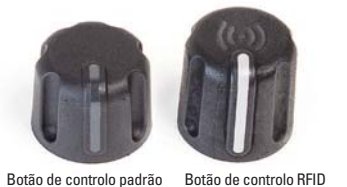
Botão de controlo padrão

◀ Anéis de identificação coloridos opcionais para grupos com diferentes tarefas, áreas de cobertura ou turnos.