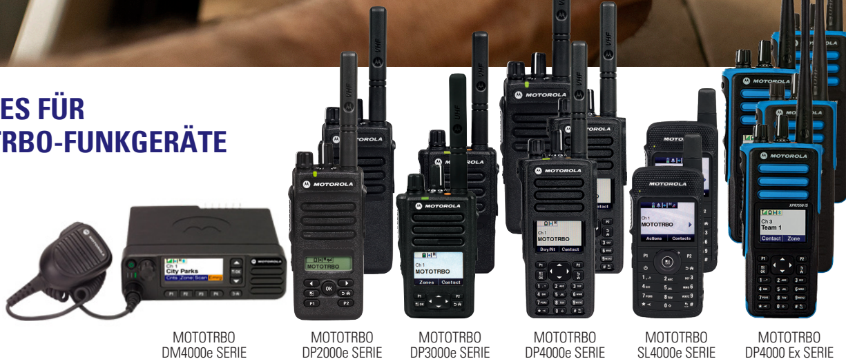
MOTOTRBO DM4000e SERIE