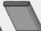
HOCHLEISTUNGS- LITHIUM- IONEN-AKKU MIT 5800 mAh* BT000593A01