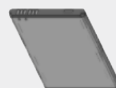
STANDARD- LITHIUM- IONEN-AKKU MIT 2900 mAh* BT000592A01