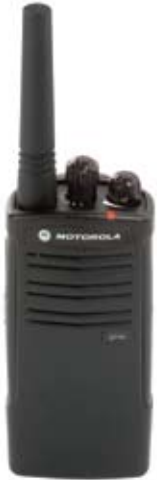
Modelo EP150 UHF

Diseñado para el entorno escolar de hoy.