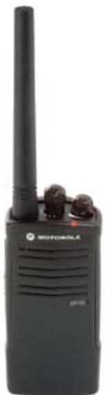
Modelo EP150 VHF

Con un peso de solo 244 g (8.6 onzas), el EP150 es cómodo para usar durante todo el día. Además, la interfaz del usuario simplifica y facilita el uso del radio con poca o ninguna capacitación.