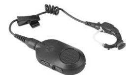
Oreillette sans fil Operations Critical

« Lorsque j'ai découvert la série SL MOTOTRBO, j'ai cru qu'il s'agissait d'un téléphone cellulaire et non d'un émetteur/récepteur radio. Elle offre toutes les capacités d'une radio, associées à un design professionnel et discret qui se marie parfaitement avec tous nos uniformes. »