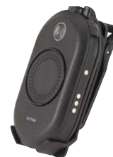
Bälteshölster med snurrfunktion