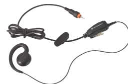
Öronsnäcka med inline PTT-knapp

Den här revolutionerande, rena designen tillhandahåller snabb laddning av din Motorola CLP. En multienhetsladdare gör att du kan ladda upp till sex Motorola-CLP-enheter samtidigt. Laddaren är försedd med en bakficka där du förvarar din öronsnäcka när enheten laddas och som kan monteras på väggen om det är ont om utrymme.