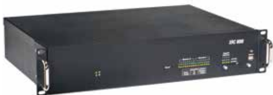
XRC 9000 Connect Plus 控制器