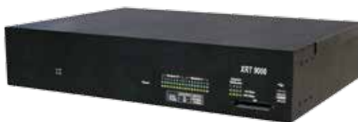
XRT 9000 Connect Plus 网关