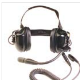
BDN6645 Casque lourd et PTT