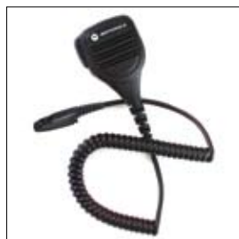
MDPMMN4023 Micro haut-parleur déporté IP57 waterproof

Le catalogue comprend également des écouteurs simples, des écouteurs avec micro, des écouteurs discrets, des casques.