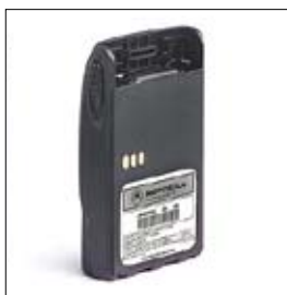
PMNN4074 Batterie Lithium Ion IP67

La puissance de communication est vitale et nécessite une batterie efficace ainsi que des solutions de chargement. La série GP-R offre des batteries Lithium Ion standard et FM ainsi que toute une gamme de chargeurs simples et multiples.