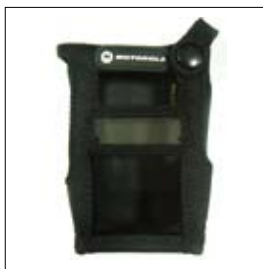
PMLN5089 Housse nylon pour radios IP67 avec écran

La série GP-R offre une gamme de solutions incluant des clips ceinture, des housses en nylon ou en cuir, pour permettre un fonctionnement main libres et améliorer la productivité de l'utilisateur.