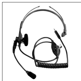
NMN6245 Casque léger avec micro sur tige et PTT