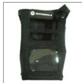
PMLN5090 Housse nylon pour radios IP67 sans écran