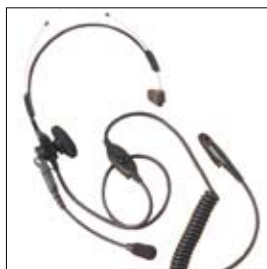
MDJMMN4066 Casque léger avec micro tige et service talkie-walkie