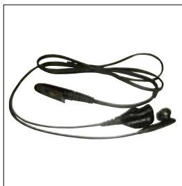
MDPMLN4519 2 écouteurs à fil avec micro et PTT