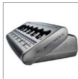
WPLN4189 Chargeur multiple Impres (prises européennes)