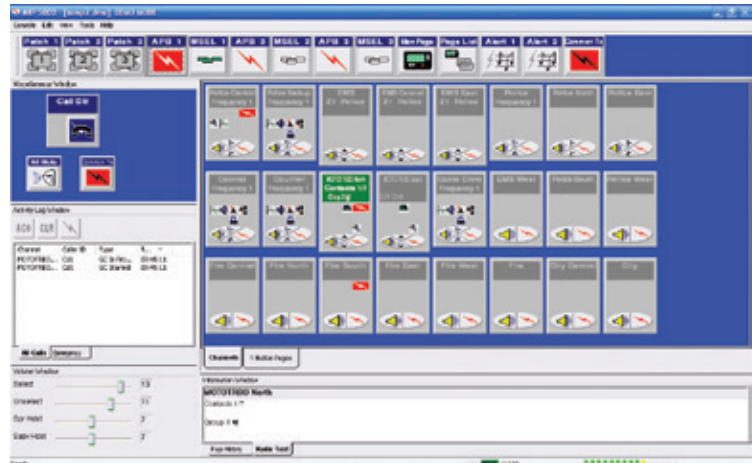
A GUI do Console de Rádio VoIP MIP 5000 oferece várias opções de usuário para o controle total da tela.

O Console de Rádio VoIP MIP 5000 admite acessórios de áudio de grau de segurança pública, os quais podem ser compatíveis com os modelos de Caixa de Conexões para Fones de Ouvido Básica e Melhorada da Motorola. Os dois modelos de Caixas de Conexões para Fones de Ouvido suportam fones de ouvido padrão da Plantronics de quatro ou seis cabos, interruptor de pé de dois pedais e microfones do tipo “pescoço de cisne” de mesa Motorola. A Caixa de Conexões Melhorada conta com uma porta adicional para suportar um telefone externo equipado com a função “call director”, um codificador de localizador