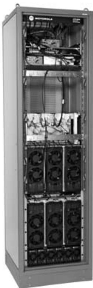
Расширяемая сайтовая подсистема GTR 8000

Устройства сайтового оборудования серии G обладают большой гибкостью и способны поддерживать как нынешние виды отказоустойчивой связи, так и будущие возможности, которые можно будет легко реализовать посредством обновления программного обеспечения. Это позволяет установить оборудование уже сегодня и постепенно его модернизировать по мере появления новых функциональных возможностей или изменения потребностей заказчика. Существуют различные конфигурации устройств сайтового оборудования серии G, в том числе: