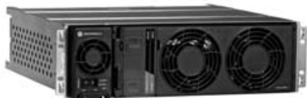
Базовая радиостанция GTR 8000 / Контроллер сайта GCP 8000 / Компаратор GCM 8000