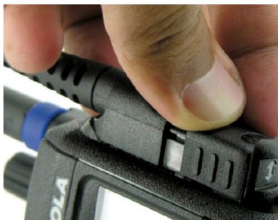
仅需单手操作，即可在短短两秒钟内，拔下接头。