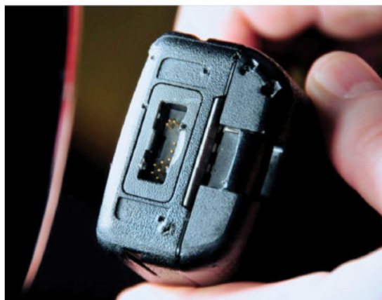
图中所示为原型对讲机在多次跌落至铺满钉子的表面后，其底部的情况。可以看出，钉子已经对对讲机表面造成了损害，但引脚却毫发无损。

这两个新型接头进一步提升了对讲机的坚固耐用性，这些接头可以承受各种情况的滥用，包括在肮脏的环境中粗暴使用以及长期腐蚀等。对于经常更换配件，有时甚至是在暗处或衣物遮掩下更换配件的用户而言，插拔快捷的侧面接头将是锦上添花的特性。这两个接头的珠联璧合，大幅提升了 MTP3000 系列 TETRA 对讲机的用户体验。