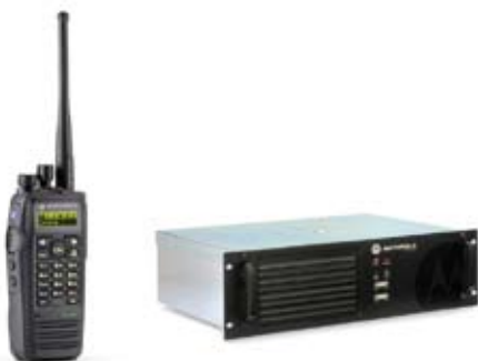
Sistema de Rádios Digitais Bidirecionais MOTOTRBO da Motorola