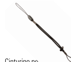
Cinturino per il polso