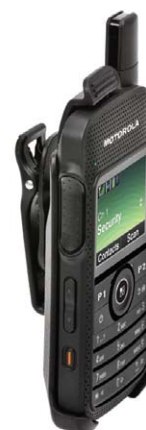
Custodia per il trasporto

Il nostro esclusivo caricabatteria multiplo coniuga elevata potenza e immagine e consente di ricaricare fino a sei radio o batterie simultaneamente. Questo caricatore è al tempo stesso funzionale e slanciato nelle forme.