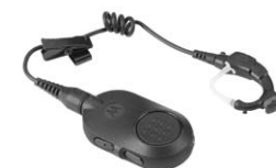
Auricolare wireless Operations Critical

“Quando ho visto per la prima volta la Serie SL di MOTOTRBO, ho pensato che fosse un telefono cellulare, non una radio ricetrasmittente. Ha tutte le funzioni di una radio bidirezionale, ma con un aspetto professionale e discreto che si adatta in maniera perfetta a tutte le nostre uniformi”.