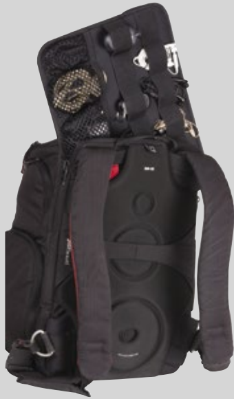
Nota: Mochila no incluida con el estuche