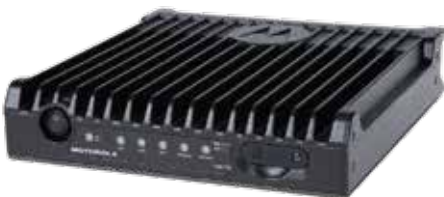
Modem LTE para veículos VML750