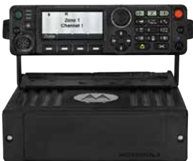
Rádio móvel APX 8500 habilitado para todas as bandas