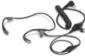
RMN5114 – Transductor de sien liviano