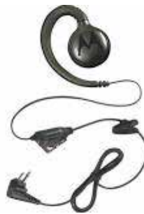
HKLN4604 – Auriculares giratorios