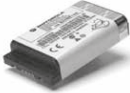
53964 – Batería de ión de litio de alta capacidad