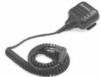
HKLN4606 – Micrófono parlante remoto