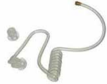
HKLN4608 – Tubo acústico transparente