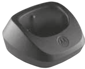
53962 – Base de bandeja de cargador