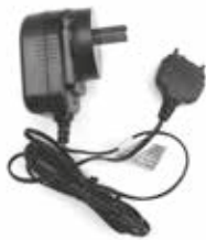
HKPN4006 – Cargador en modo de conmutación / Fuente de alimentación con conector para Argentina