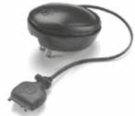
53969 – Fuente de alimentación para carga rápida de 1 hora