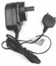
HKPN4006 – Cargador en modo de conmutación / Fuente de alimentación con conector para Argentina