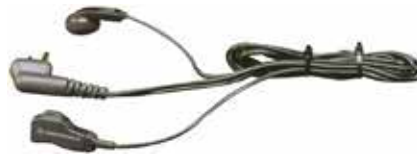
53866 – Audífono con PTT y micrófono con sujetador