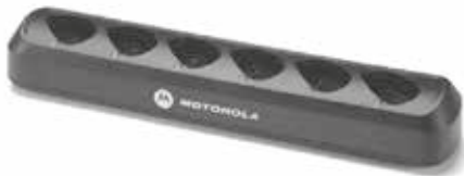
53960 – Cargador múltiple para 6 radios