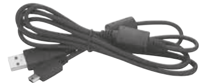
0105950U15 – Cable de Programación para DTR