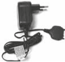
HKPN4005 – Cargador en modo de conmutación / Fuente de alimentación con conector para Brasil