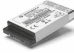
53963 – Batería de ión de litio de capacidad estándar