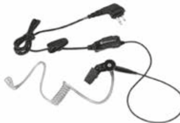
HKLN4601 – Auriculares para vigilancia