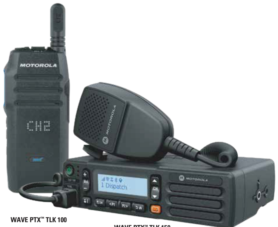
WAVE PTX™ TLK 100

Lo suficientemente compacto para montaje sobre el tablero –puede ir arriba, adentro o debajo del tablero. Optimice el valor de lo ya invertido en infraestructura con los kits de montaje Motorola XPR 2500.