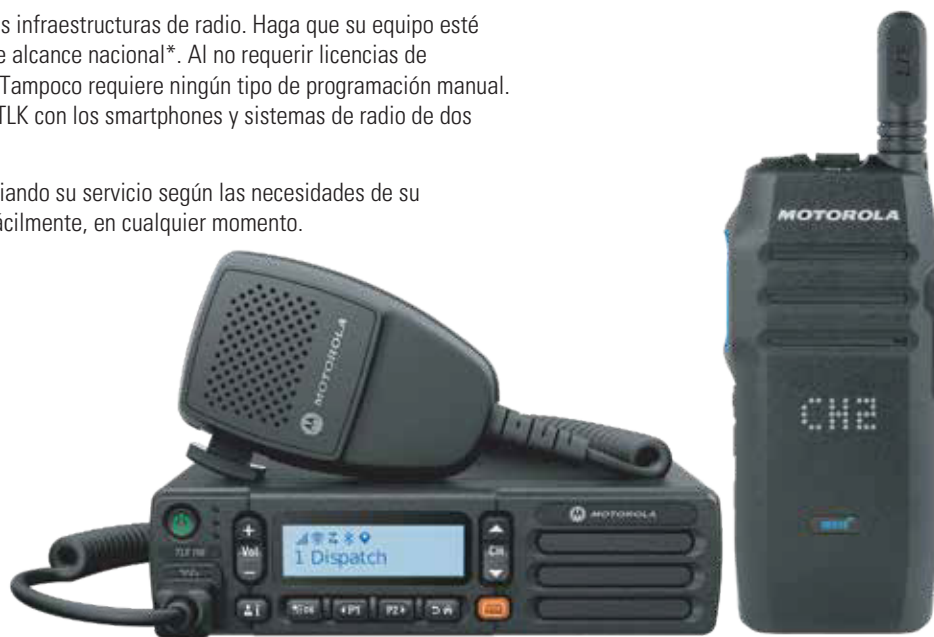
WAVE PTX™ TLK 150