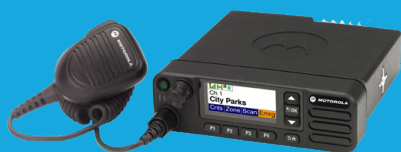
Series DGM™ 8000/DGM™ 5000 y DGM™ 8000e/DGM™ 5000e