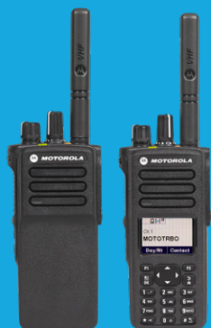
Series DGP™ 8000/DGP™ 5000 y DGP™ 8000e/DGP™ 5000e