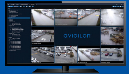
AVIGILON CONTROL CENTER [CENTRO DE CONTROLE AVIGILON]