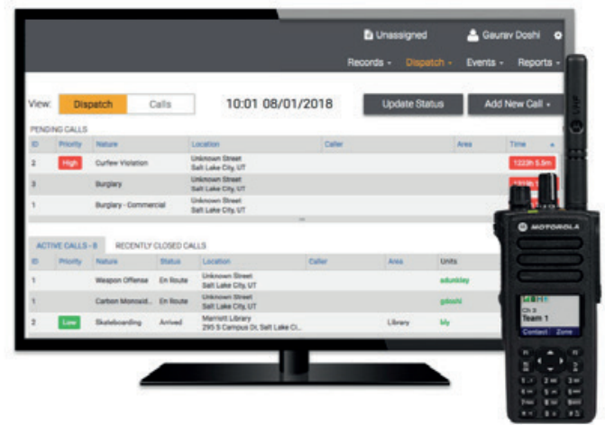
Gestión de Incidentes

Permitir uma resposta rápida e documentar incidentes passados pode ser a chave para evitar que os incidentes se tornem em tragédias.