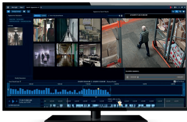
Búsqueda por apariencia de Avigilon

Por último, estas soluções e informações são cruciais para se concentrar no que mais importa, localizando pontos de interesse de forma proativa e reconhecendo os eventos importantes, para que você possa monitorar a cena e tomar decisões informadas para entrar em ação.