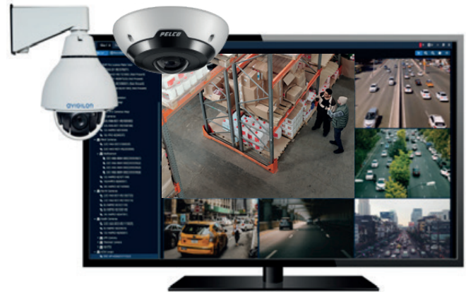
Câmeras de vídeo segurança Avigilon e Pelco

Tudo isso se combina para proporcionar melhores informações - para que você sempre saiba o que está acontecendo em suas instalações.