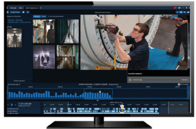
Búsqueda por apariencia

Por último, estas soluciones e información son fundamentales para centrarse en lo importante, localizando de forma proactiva puntos de interés y reconociendo los eventos importantes – a fin de que pueda monitorear la escena y tomar decisiones fundamentadas para entrar en acción.