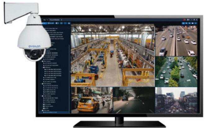
Cámaras de video seguridad Avigilon

Todo esto se combina para brindarle mejor información – a fin de que siempre sepa qué está pasando en sus instalaciones.