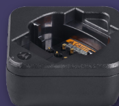
PMPN4587 CARREGADOR INDIVIDUAL