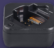
PMPN4587 CARGADOR PARA UNA UNIDAD