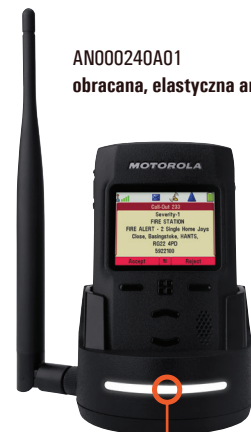
PMPN4142A stacja główna