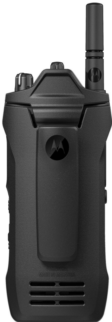
ÉTUI DE TRANSPORT AVEC CLIP DE CEINTURE FIXE DE 2,5" (RADIO VENDUE SÉPARÉMENT)