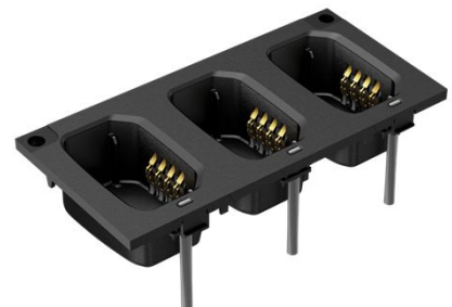
ADAPTATEUR MOTOTRBO ION POUR CHARGEURS MULTI-UNITÉS MOTOTRBO EXISTANTS 9