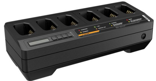
CHARGEUR MULTI-UNITÉS IMPRES 2 - 6 EMBLEMES