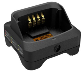
CHARGEUR IMPRES™ 2 UNE SEULE UNITÉ