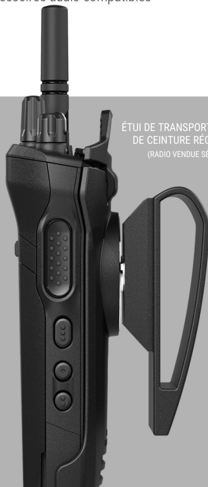
ÉTUI DE TRANSPORT AVEC BOUCLE DE CEINTURE RÉGLABLE DE 2" (RADIO VENDUE SÉPARÉMENT)

Boucle de ceinture réglable en cuir rigide de 3" PMLN5409